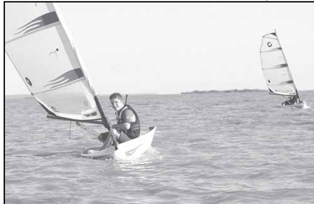
O programa tem por objetivo estimular e desenvolver o esporte por meio de organizações esportivas e sociais