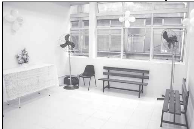
Local recebeu piso cerâmico, além de paredes e janelas recuperadas