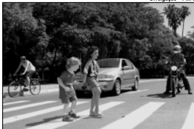
Motoristas e pedestres vão receber cartões de Natal com mensagens para uma circulação sem rivalidades