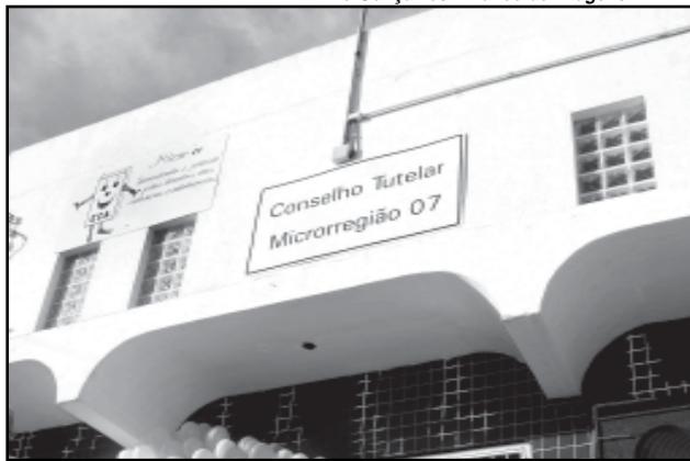
O prédio alugado recebeu investimento de R$ 10 mil para adequação do espaço