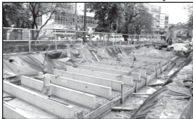
Obra, como o Conduto Álvaro Chaves-Goethe, integra o programa de desenvolvimento municipal