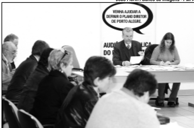
Novo encontro será amanhã, 24, às 18h

Após passar pelo Conselho, o anteprojeto de revisão do Plano Diretor de Desenvolvimento Urbano Ambiental (PDDUA) é encaminhado ao prefeito, que enviará o Projeto de Lei para votação do Legislativo.