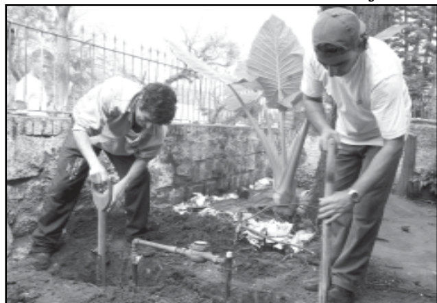
Além da negociação, serão oferecidos serviços a cargo de duas equipes operacionais