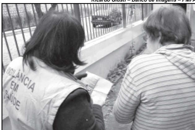
O encontro deve reunir gestores municipais e estaduais, educadores e técnicos da área de vigilância em Saúde