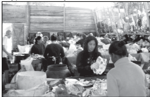
O novo espaço é uma das 14 unidades conveniadas ao DMLU