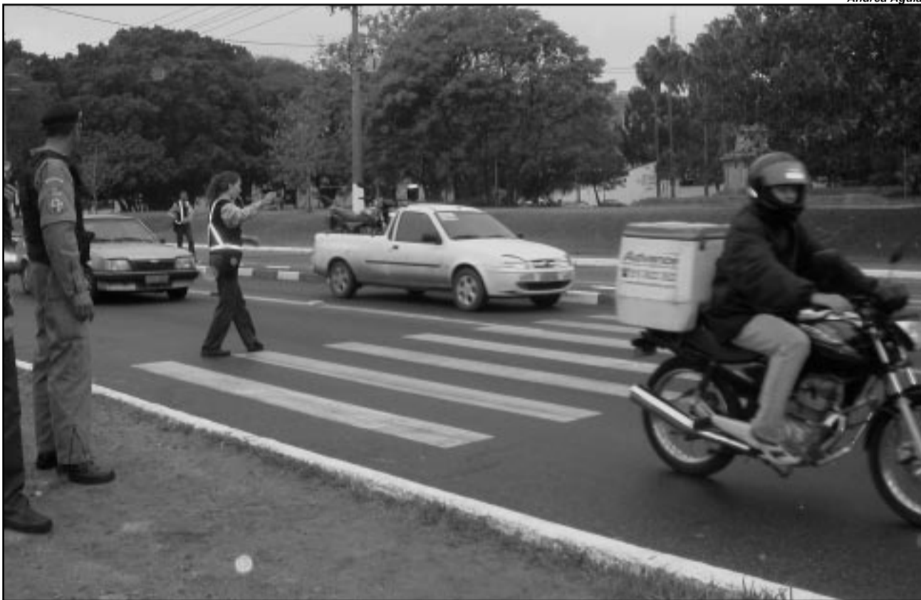
Nas ruas da Capital um total de 136 agentes de trânsito orienta motoristas e pedestres