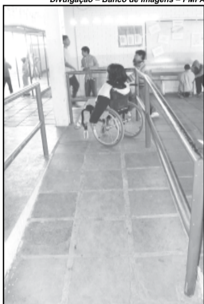
A construção de rampas faz parte dos investimentos em equipamentos para alunos deficientes nas escolas

A s escolas da rede municipal adaptam-se, gradualmente, para assegurar maior inclusão e acessibilidade dentro das políticas da administração municipal. Cerca de 60% dos estabelecimentos municipais de ensino de Porto Alegre estão mais acessíveis. A rede municipal tem 3.984 alunos com deficiências diferenciadas matriculados. Ao contrário da rede regular, que conta com período de matrículas específico, na educação especial o acesso é em qualquer dia do ano, desde que existam vagas. Os estudantes com necessidades especiais são incluídos nas quatro escolas especiais e nas demais escolas regulares da rede, com 93 instituições de ensino, entre Educação Infantil, Ensino Fundamental e Educação de Jovens e Adultos (EJA).