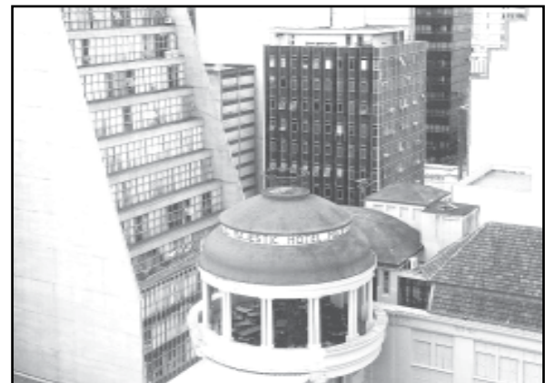
Abóbada da Casa de Cultura