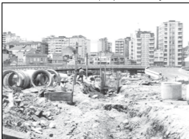
Exposição mostra crescimento da cidade nos últimos 60 anos

A programação das comemorações dos 236 anos da cidade será aberta oficialmente pela prefeitura nesta segunda-feira com a exposição fotográfica Porto Alegre em imagens: seis décadas de transformação da Capital , que resgata as mudanças urbanas, sociais, econômicas e políticas da cidade. A mostra será inaugurada, às 14h30, em frente ao Paço Municipal. Para a cerimônia de abertura foram convidados todos os ex-prefeitos da cidade.