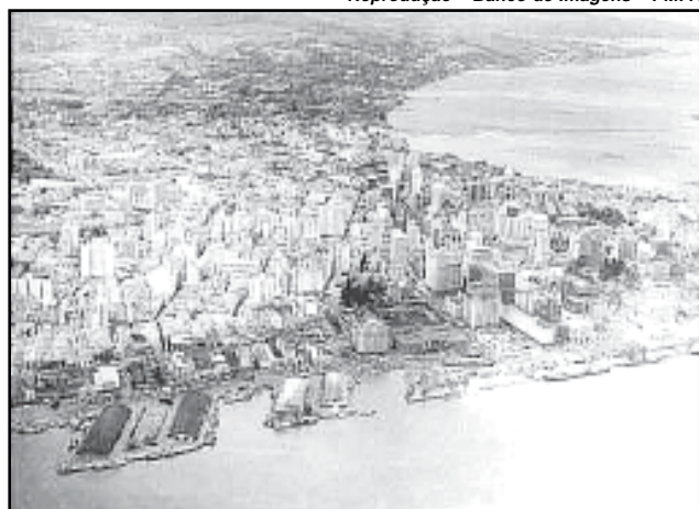
Na época da foto, Porto Alegre tinha 394 mil habitantes