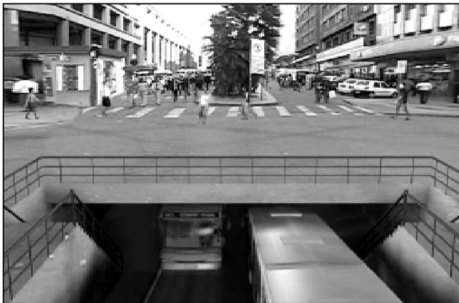
O projeto Portais da Cidade prevê um túnel sob a Borges de Medeiros a ser executado através das PPPs

- Um dos requisitos fundamentais da Prefeitura para a implantação das PPPs é a garantia da finalidade social dos projetos a serem realizados. O governo define as prioridades em termos de serviço e o parceiro privado define a forma de execução e o custo. Entre outras, as PPPs poderão contemplar iniciativas nas áreas de turismo, transportes, construção de shoppings populares e habitação.