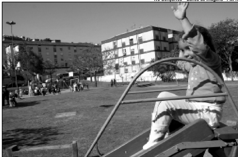
O novo decreto regulamenta pela primeira vez o uso das praças