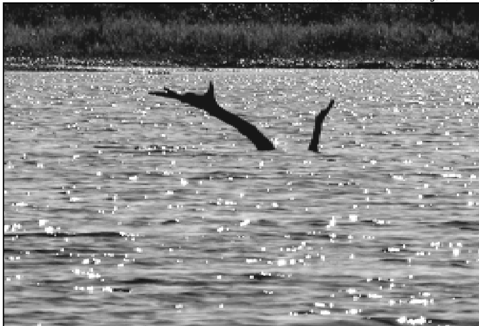
A reserva do Lami José Lutzenberger é a primeira reserva biológica municipal do Brasil