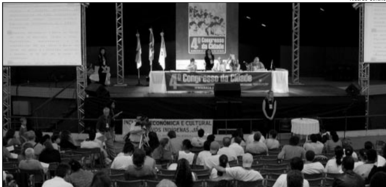
Plenária final foi realizada no final de semana, no Auditório Araújo Vianna