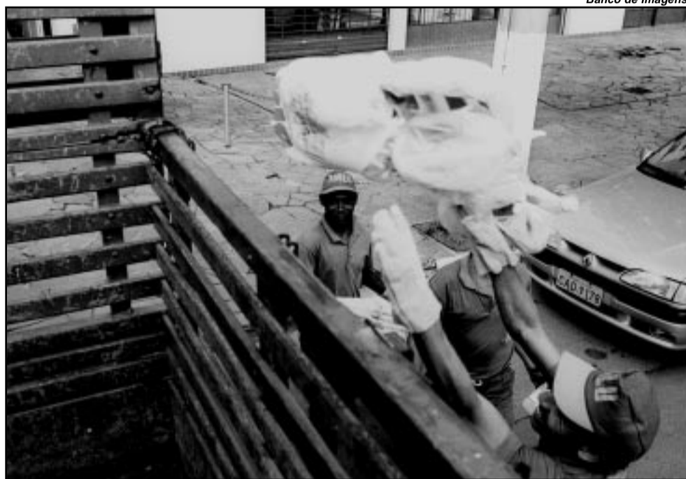
Banco de Imagens

Após esta análise, o departamento publicará edital, indicando as empresas habilitadas e as não-habilitadas. Depois da fase de recursos em relação a este edital, é aberto prazo para a segunda etapa da licitação, em que as concorrentes habilitadas apresentam suas propostas para a decisão final sobre a vencedora.