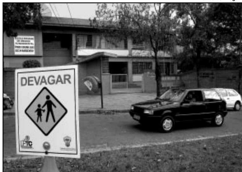
Importância dos equipamentos é explicada nas escolas