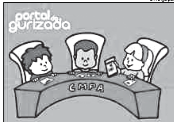
Link destina-se a crianças e jovens