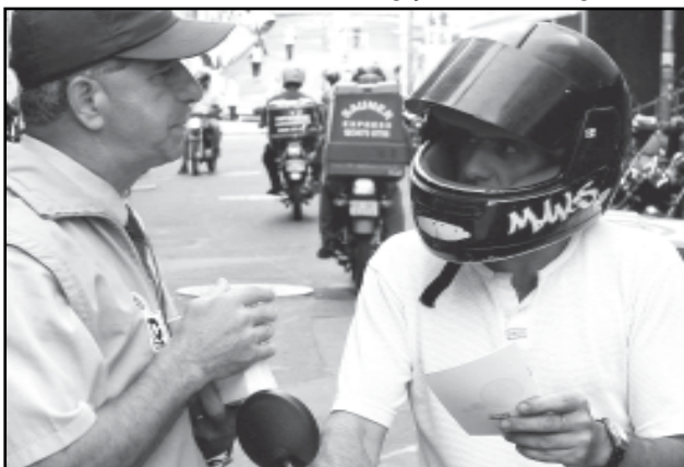
As ações de hoje serão dirigidas aos motociclistas

Sexta-feira, 26 - Palestra Direção Defensiva, no Call Center da Zero Hora (Andradas 1001 - 3º Piso), às 14h.