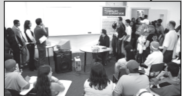
Sorteio Público Eletrônico das vagas foi acompanhado pelos candidatos