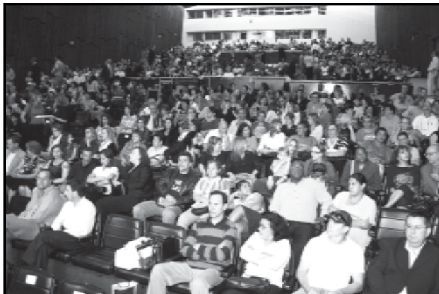
Solenidade homenageou os servidores que completaram 25 anos de serviços em 2007