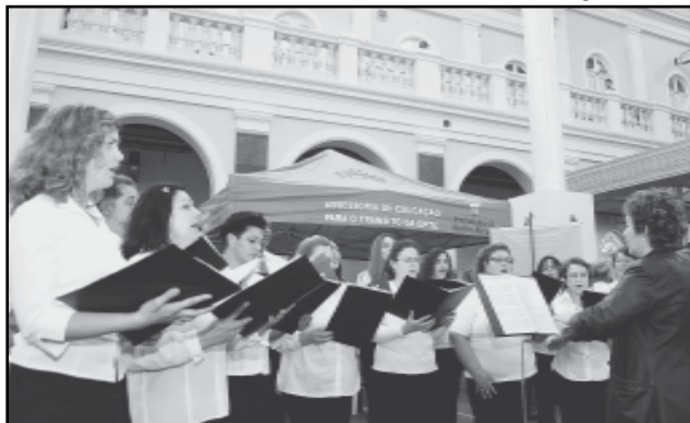
Coral de Servidores participa da abertura da Semana