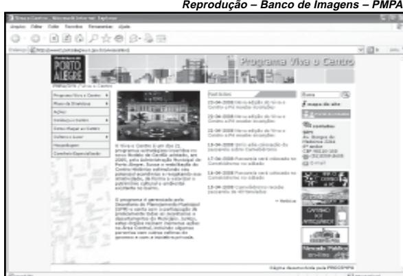
Maior interesse dos internautas é pela seção Conheça o Centro