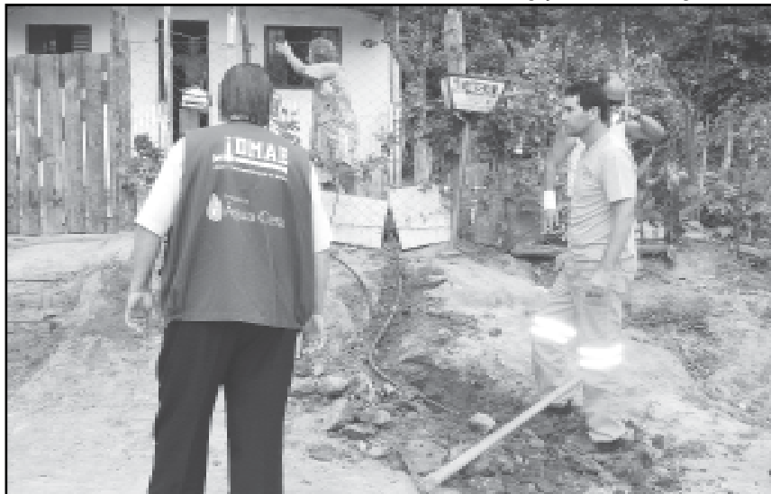
O Água Certa foi criado em 2005 com objetivo de regularizar as ligações de água

O Água Certa foi criado em 2005, em parceria com a Secretaria Municipal de Coordenação Política e Governança