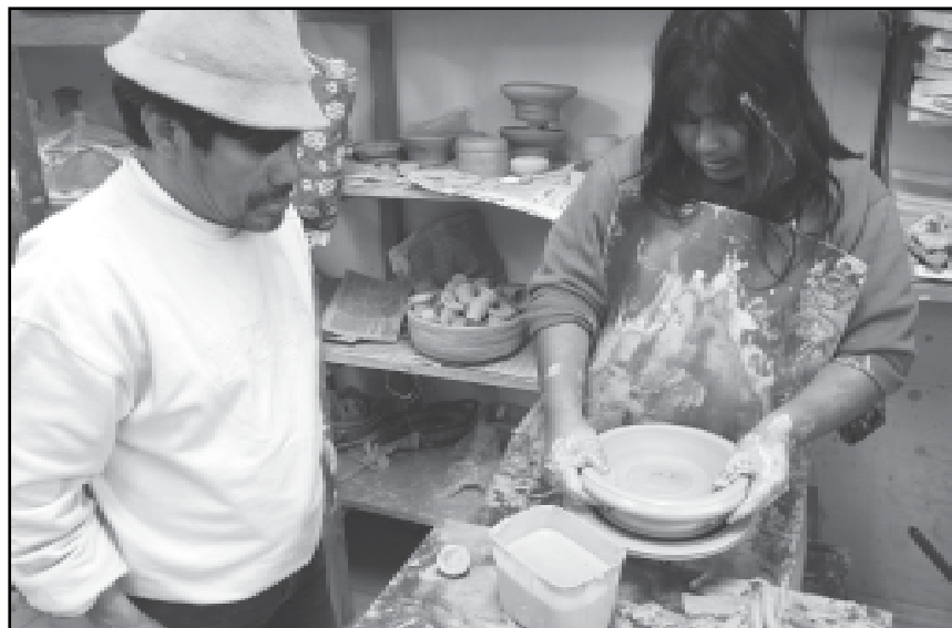
Índios diversificam artesanato com cerâmica

dos na floresta, deixando de lado um pouco os cipós para diversificar a produção, qualificando o artesanato indígena. Esse trabalho, que teve início em fevereiro, no Espaço de Sustentabilidade Caingangue, na Parada 25, da Lomba do Pinheiro, com recursos da parceria com o Governo Basco, da Espanha, por intermédio da ONG Paz Y Solidaridad, preparou jovens e adultos à produção de novas formas de artesanato para melhorar a qualidade de vida de 23 famílias indígenas ali instaladas. Hoje, eles têm um atelier, com forno e instrumentais.