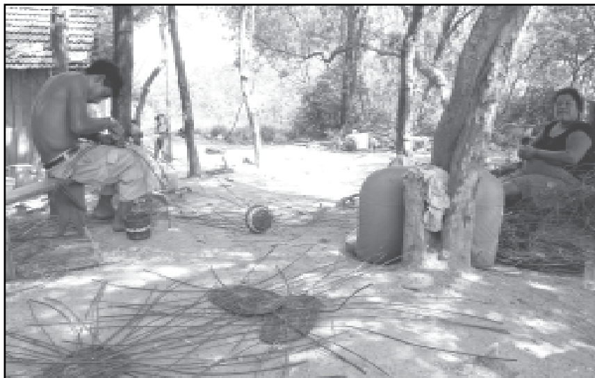
Espaço de Sustentabilidade permite que famílias preservem a cultura do povo Caingangue