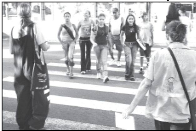
As atividades terão como foco principal o respeito e uso da faixa de segurança