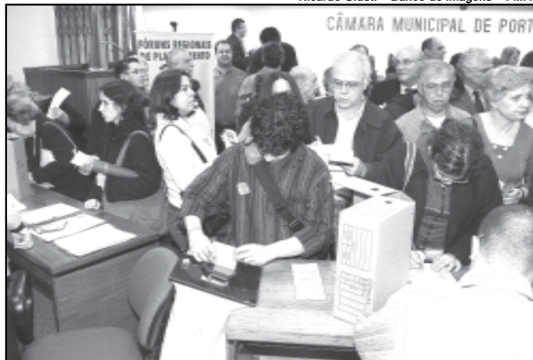
As eleições foram realizadas em 2007