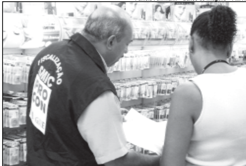
Agentes entregam manual do lojista em shopping

Pâmela Fuhrmann – Banco de Imagens – PMPA