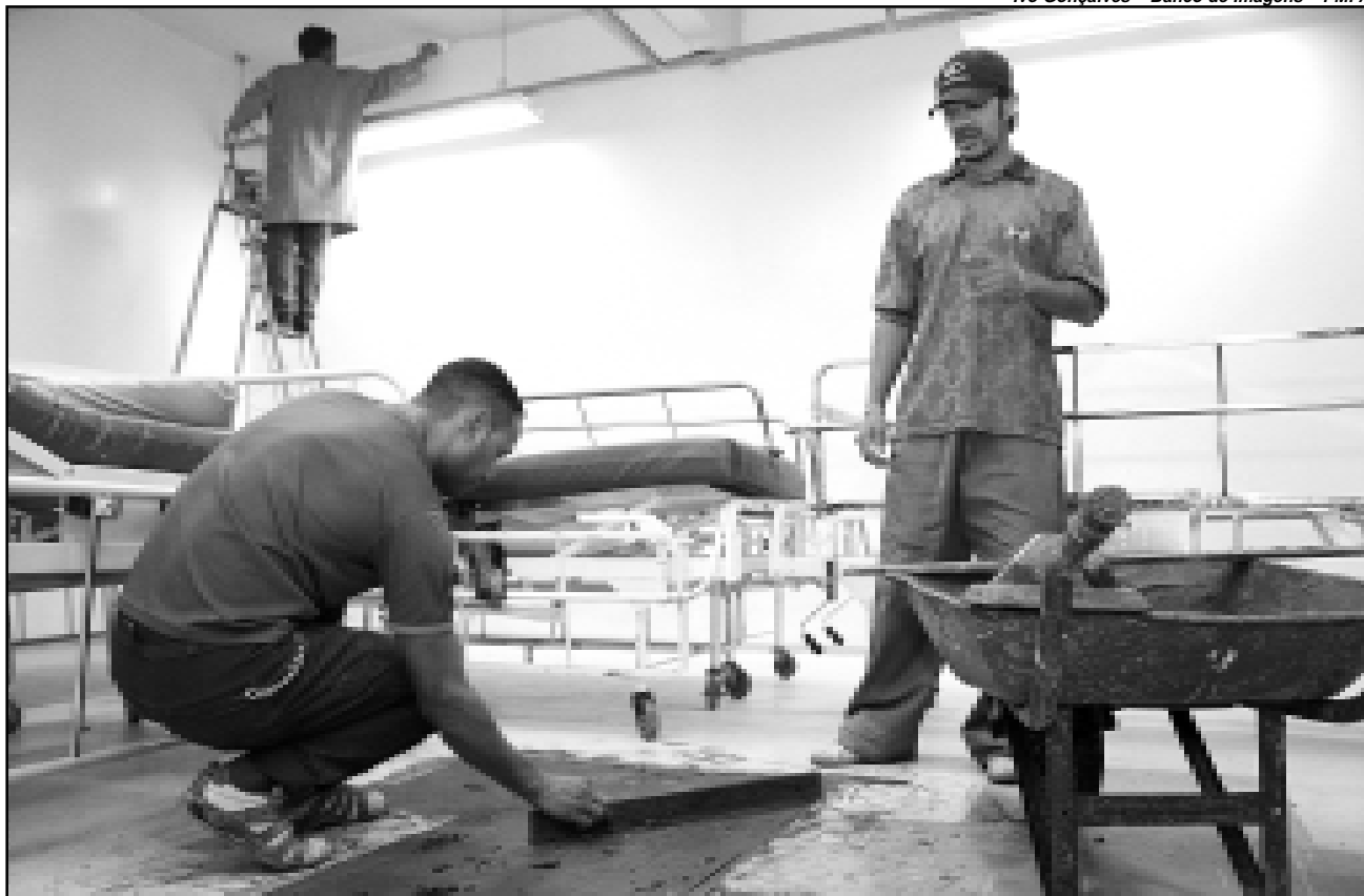
Obras estão sendo feitas em ritmo acelerado