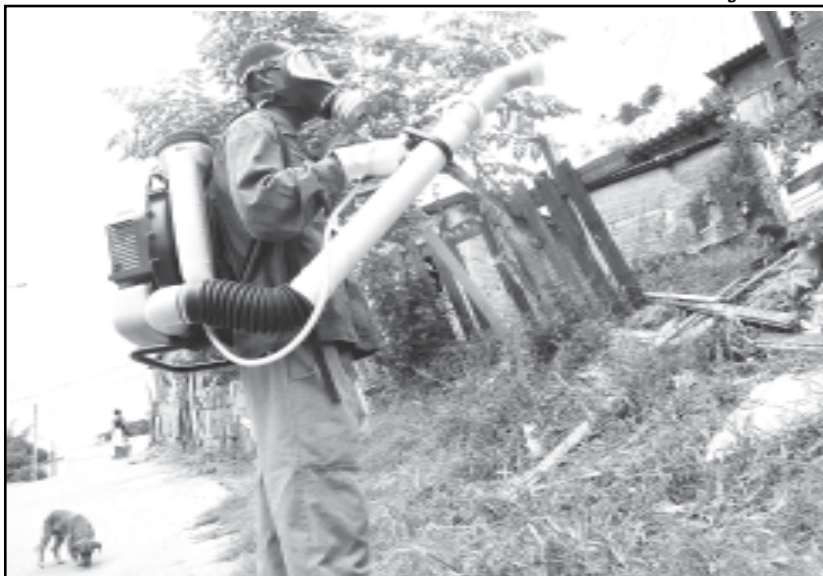
Aplicação faz parte de ação de bloqueio do mosquito

rio que haja um esforço de todos para evitar a proliferação. Além da eliminação de possíveis focos de larvas do mosquito (recipientes com água parada, garrafas vazias, pneus e ralos sem uso, por exemplo), é importante que os moradores de áreas com casos confirmados da doença utilizem repelentes elétricos e corporais.