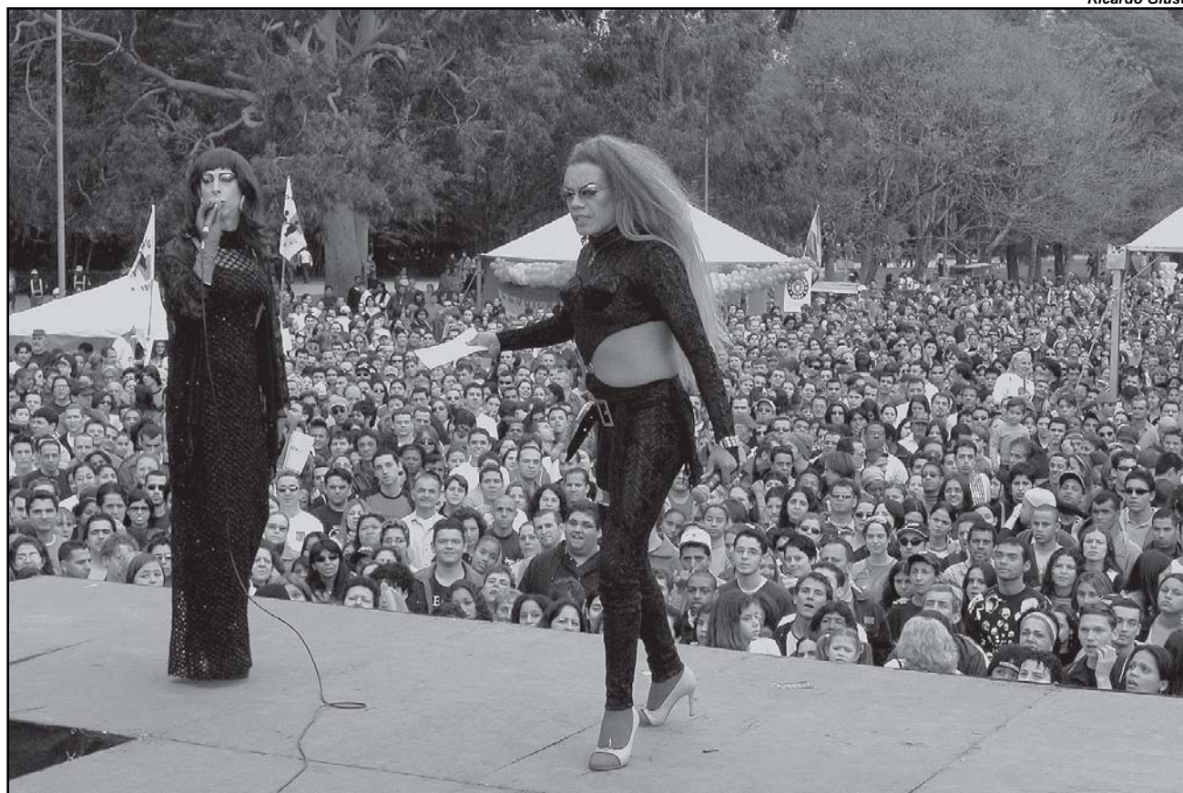
Objetivo é promover os direitos de gays, lésbicas, travestis, bissexuais e transgêneros