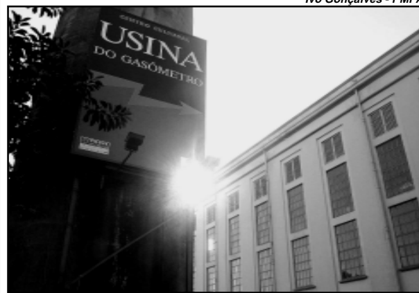
Quarto andar da Usina é um dos locais disponíveis