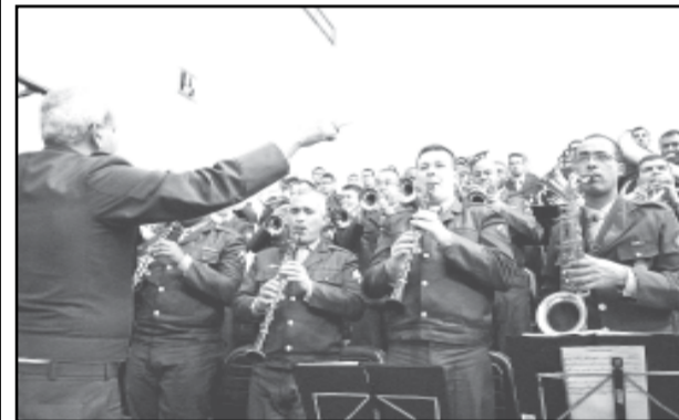
Exército participou da solenidade