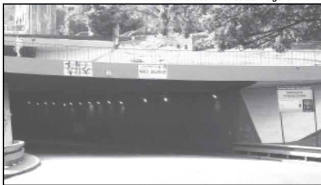
Revitalização tem 40% das obras concluídas

A DLC verificou que, após serem pintados, os viadutos sofrem novas pichações, porém, depois de algumas limpezas, o número de pichações tem uma redução significativa. Desde que foi revitalizado, em agosto de 2007, o viaduto Dom Pedro I (José de Alencar/Padre Cacique) foi pichado 6 vezes. Segundo Marcelo Hoffmann, a última