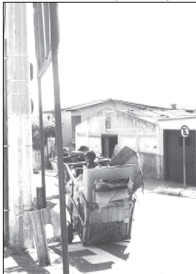
A principal atividade realizada na rua pelas crianças e adolescentes é trabalhar