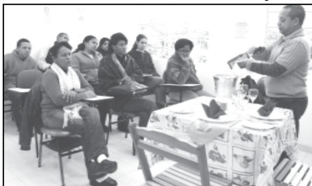
Próximo curso é o de auxiliar de cozinha, em agosto

Estrutura — O novo órgão conterà a seguinte estrutura básica: Ga-