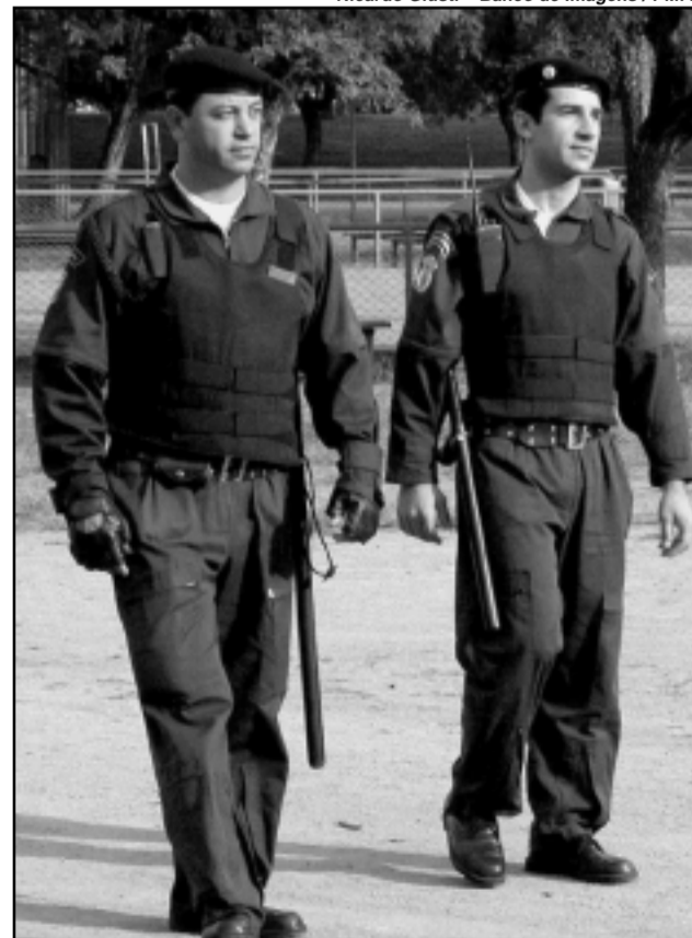
Além da segurança a guarda municipal vai participar de campanha de prevenção ao uso de drogas