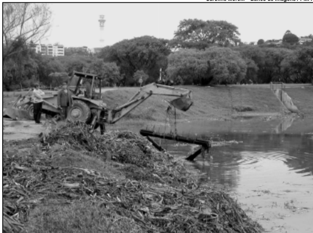
A Bacia de retenção do Parque Marinha do Brasil, construída em 2000, recebeu a primeira limpeza este ano