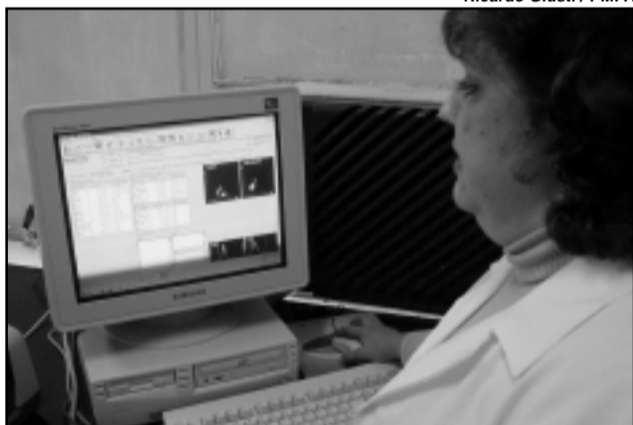
O Laboratório Central é comparado aos melhores do país