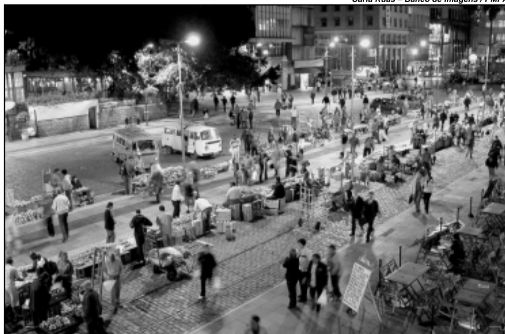
Smic orienta população a comprar nos pontos autorizados de venda