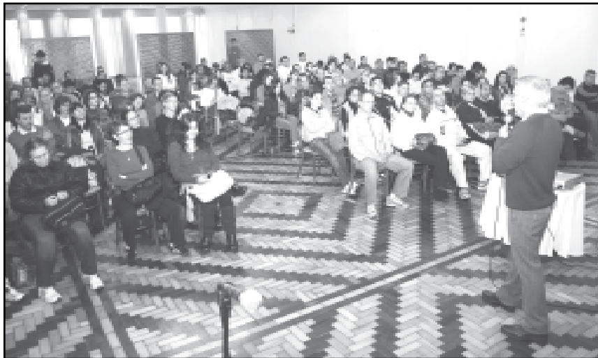
Encontro termina amanhã