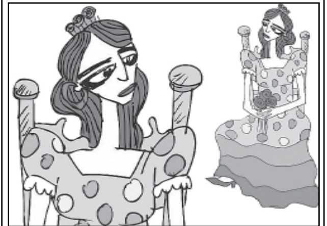
Exposição homenageia bailarina