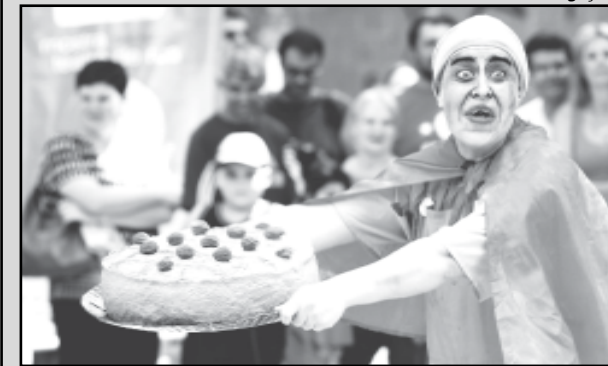
Kiran / Divulgação

Calendário: dia 28/5, às 15h30 (UT Rubem Berta); dia 29/5, às 14h45 (UT Cavallhada); dia 5/6, às 15h (UT Campo da Tuca); dia 6/6, às 14h (UTC Lomba do Pinheiro); dia 9/6, às 16h (UT Aparecida das Águas); dia 10/6, às 15h (UT Ilha Grande dos Marinheiros); dia 11, às 16h30 (UT Vila Pinto).