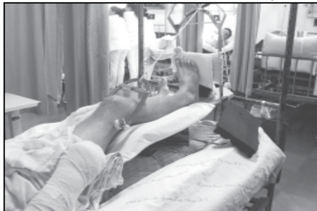
Em 2008, foram atendidas 15,8 mil vítimas de acidentes de trânsito