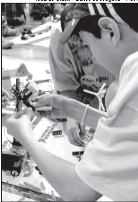
O campeonato teve a participação de 41 equipes