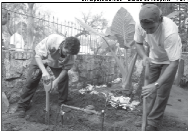
O Água Certa promove mutirões de regularização, parcelamento de dívidas e serviços