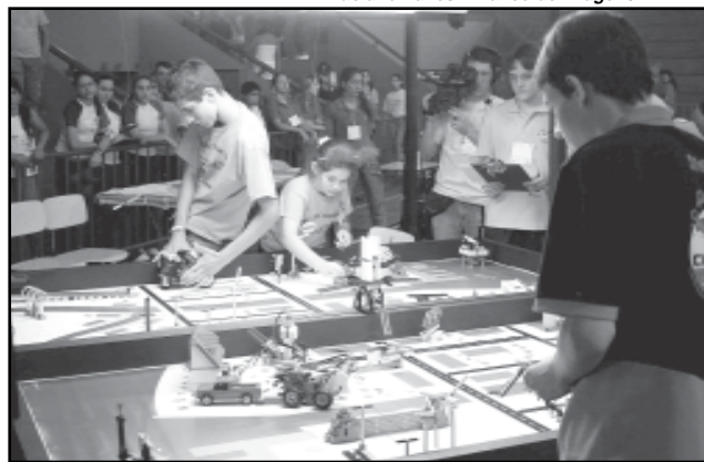
Professores e alunos trabalharam inclusive aos finais de semana e à noite em pesquisa e montagem do robô