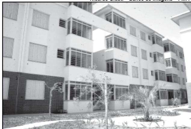
Condomínios como o Princesa Isabel fazem parte das ações do programa