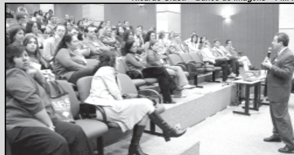
O encontro será a culminância das discussões e ações realizadas desde 2005