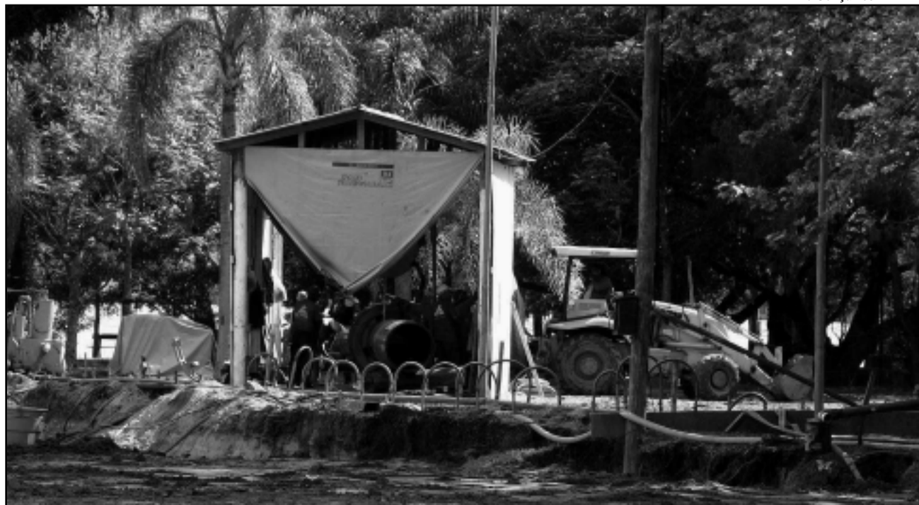
As obras vão permitir captar em um ponto mais profundo e de maior correnteza, onde a água é mais rica em biodiversidade