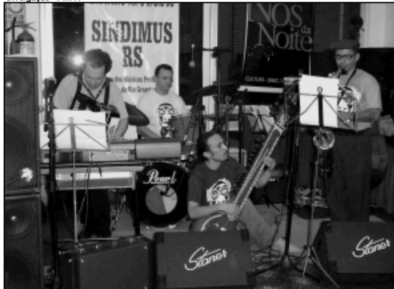
Lançamento do CD afro jazz do Trio de Janeiro, no Teatro Renascença

integrando a programação do Projeto “Nós da Noite” da Secretaria Municipal da Cultura, no Fover do Teatro Renascença, seu primeiro CD, mesclando música folclórica brasileira, com elementos da música africana e jazz europeu contemporâneo. O Trio de Janeiro acredita que essa linguagem seja o novo capítulo da post-moderna música improvisada e vê sua música como alegre futuro do Jazz.