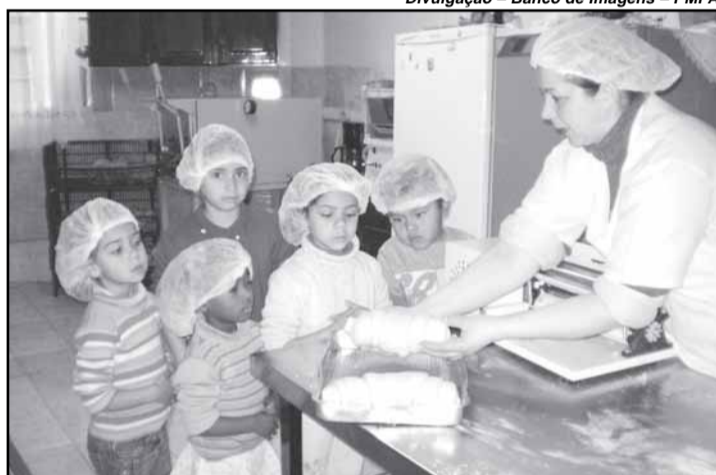
Crianças testaram receitas como o pão caseiro de João e Maria