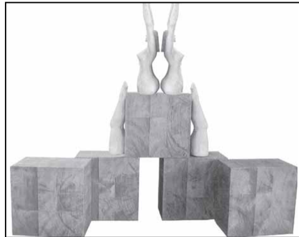
Artista cria esculturas em cerâmica