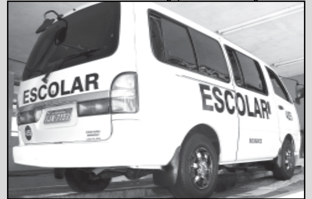
Frota da Capital tem 621 veículos registrados