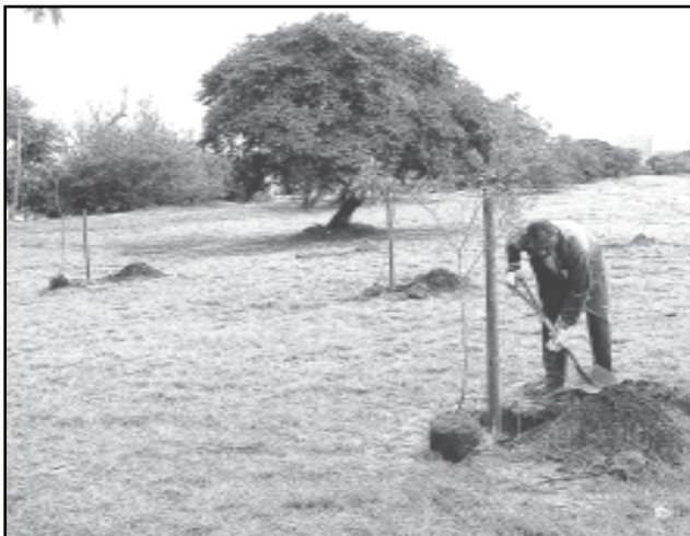
Os novos procedimentos aumentam a chance das novas árvores sobreviverem