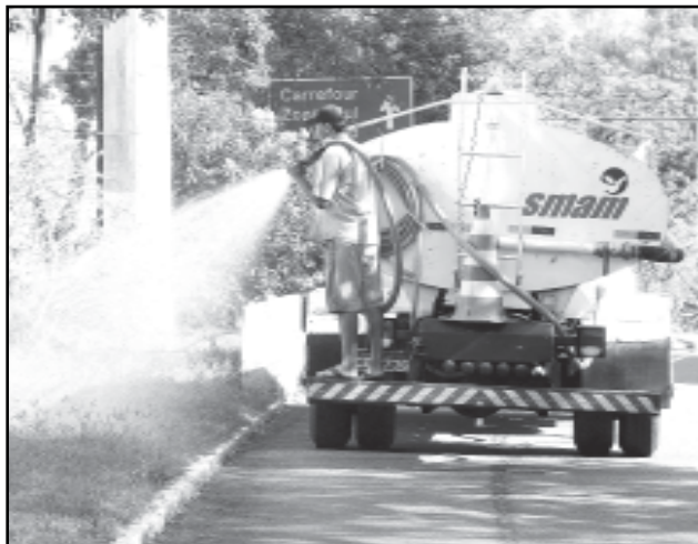
Seis caminhões molham as mudas periodicamente