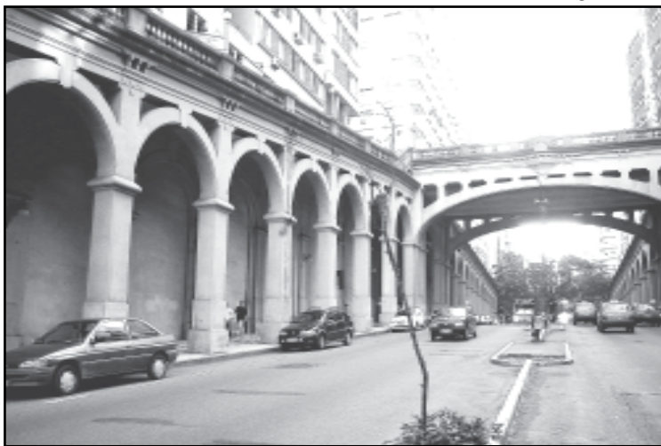
Oito câmeras de alta definição serão colocadas no local

A prefeitura, por meio de ações promovidas pela Secretaria Municipal de Obras e Viação (Smov), reduziu em 74,5% o gasto com a recuperação da iluminação pública depredada por ações de vândalos, no segundo semestre de 2007. O anúncio foi feito pelo secretário de Obras e Viação, durante visita ao