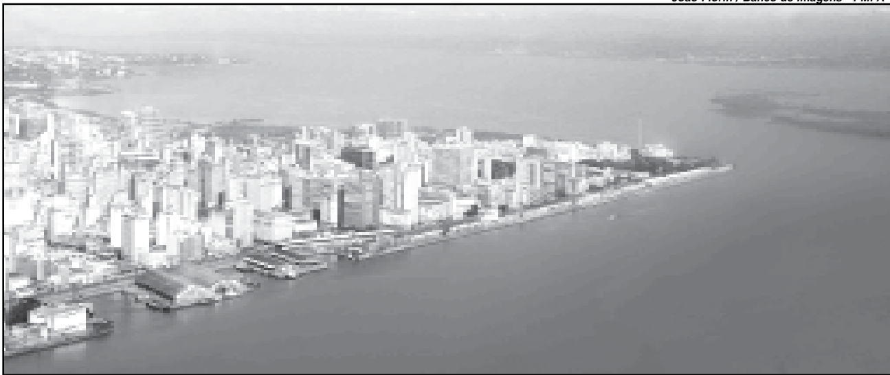
Revitalização deve acontecer com Parceria Público Privada

Começou na semana passada a primeira etapa de formatação do projeto de revitalização da orla do Guaíba. Durante encontro realizado no Rio de Janeiro, representantes da Fundação Getúlio Vargas (FGV) e o secretário do Planejamento Municipal (SPM) começaram discutir as melhores alternativas para a estruturação do plano.