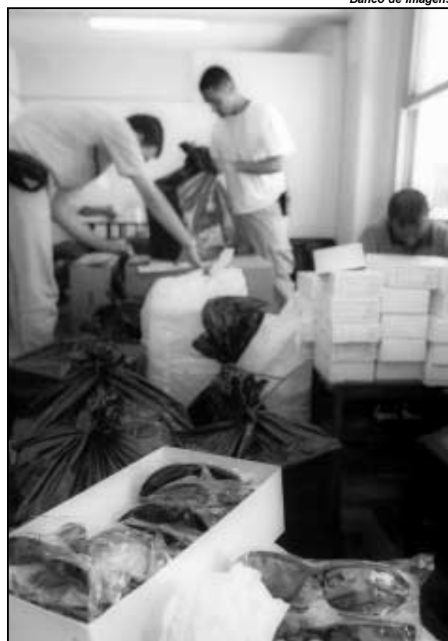
Produto irregular pode causar uma série de danos à saúde, inclusive cegueira

Na avaliação da Smic, as vendas ilegais podem aumen-