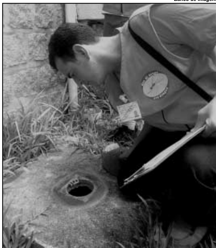
Agentes eliminam criadouros do mosquito Aedes aegypti e orientam moradores

2001 os primeiros focos do Aedes aegypti . Até o momento não se registraram casos de transmissão da dengue. No verão, contudo, a reprodução do mosquito é rápida. Além disto, com o início do período de férias, os moradores viajam para regiões onde há dengue, sofrem contaminação e retornam doentes. O controle desta doença começa nas casas, com a eliminação de recipientes que possam acumular água.