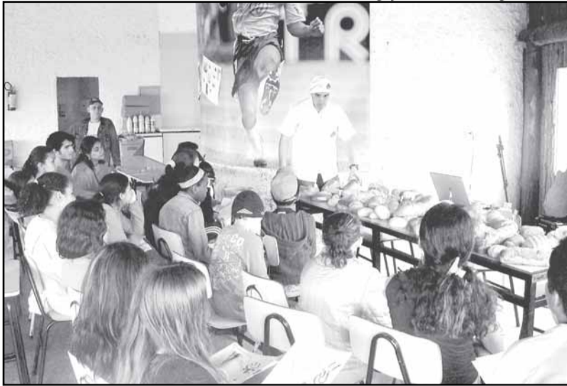
Oficinas demonstram características de cada profissão

Prefeitura está investindo R$ 21 milhões na revitalização asfáltica