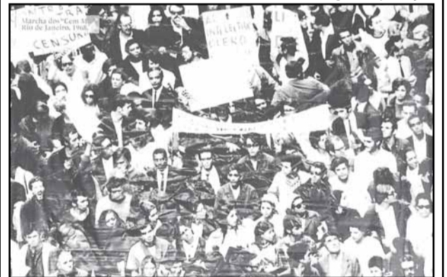
Marcha dos Cem Mil, no Rio de Janeiro