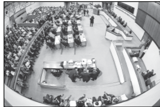
Plenário da CMA em atividade