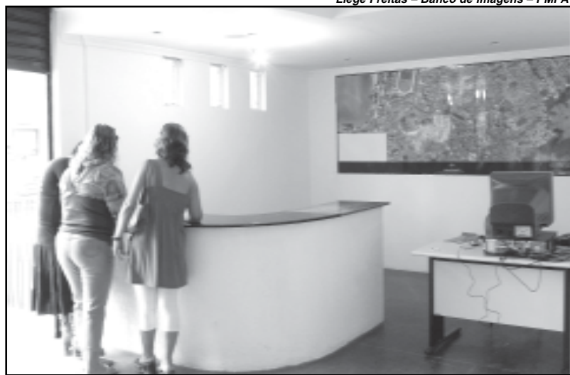
Escritório do Pisa vai atender mais de 1,6 mil famílias que serão reassentadas