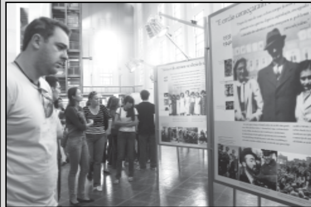
A mostra já percorreu mais de 30 países desde 1996