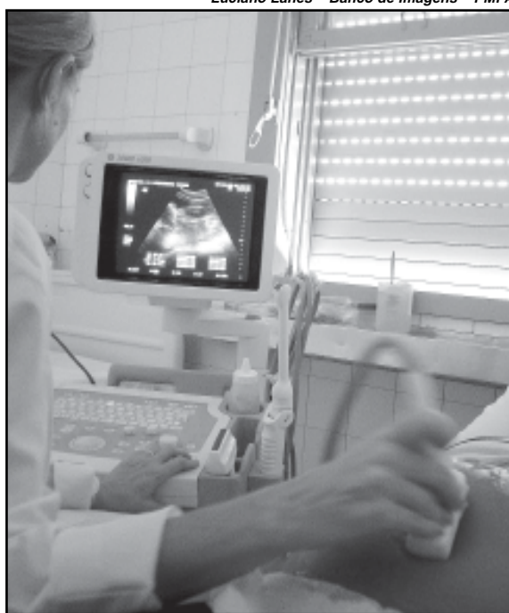
Na primeira etapa serão disponibilizados 40 exames mensais, sempre às sextas-feiras

Telemedicina — De acordo com a Organização Mundial de Saúde, telemedicina é a oferta de serviços ligados aos cuidados com a saúde, nos casos em que a distância é um fator crítico. Esses serviços são prestados por profissionais da área da saúde, usando tecnologias de informação e de comunicação para o intercâmbio de informações válidas para diagnósticos, prevenção e tratamento de doenças e a contínua educação de prestadores de serviços em saúde, assim como para fins de pesquisas e avaliações.