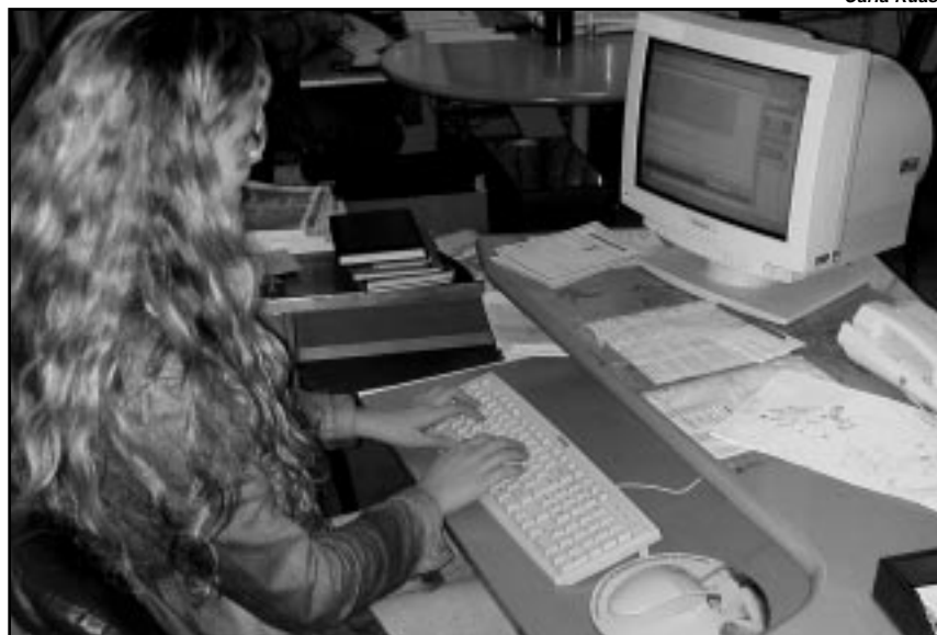
Cada computador da rede municipal tem programa antivírus