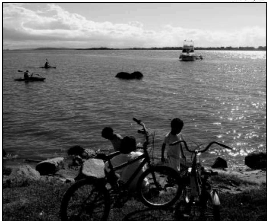
Reintegração da cidade com seu lago é uma das diretrizes da iniciativa