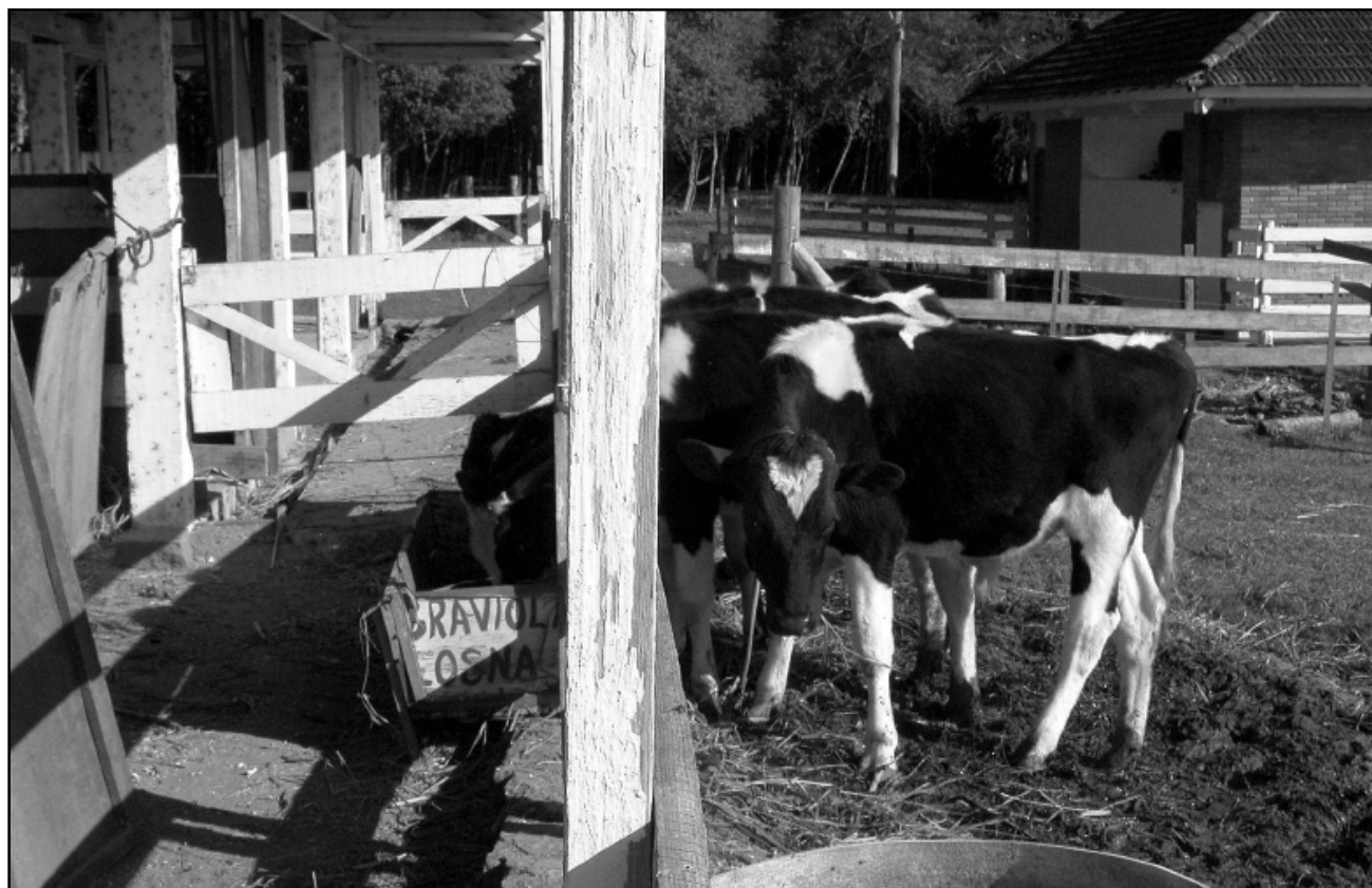
A criação de animais é uma das atividades do Centro Agrícola Demonstrativo, localizado na Lomba do Pinheiro

A divisão de fomento agropecuário da Smic tem como meta o desenvolvimento agropecuário da área rural de Porto Alegre, dentro do Projeto Cresce Porto Alegre de incentivo à produção primária.