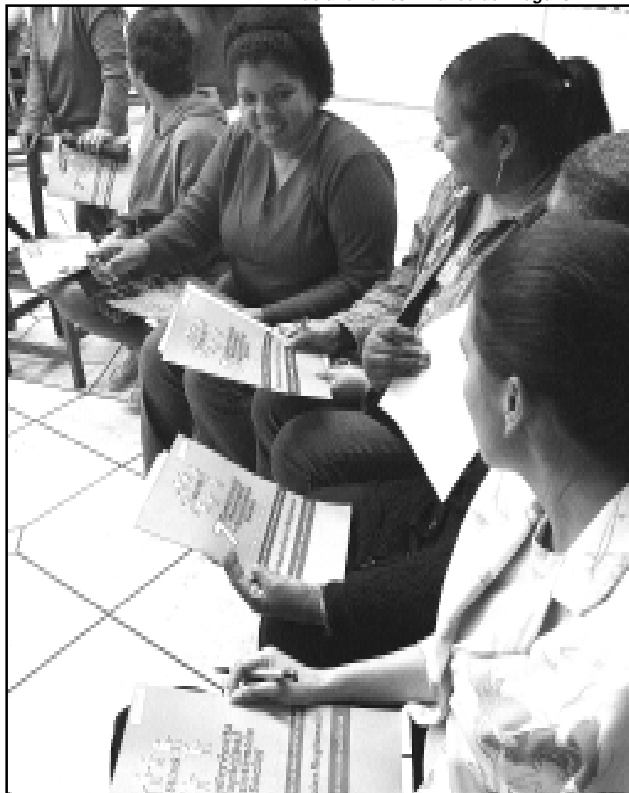
As pré-conferências de assistência social foram realizadas nos meses de maio e junho