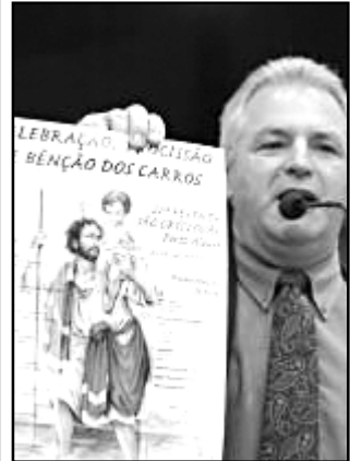
Brehm convidou vereadores

ocorrerão às 18h30min, e, a partir do dia 16 (segunda-feira), às 20 horas. No dia 22 de julho, haverá missa às 9 horas, seguida de carreata a partir das 10h30min até o Santuário de Fátima, junto ao Colégio São Francisco, onde será servido almoço. A festa ainda incluirá bênção dos carros durante a carreata, bingo, baile e brincadeiras para as crianças.