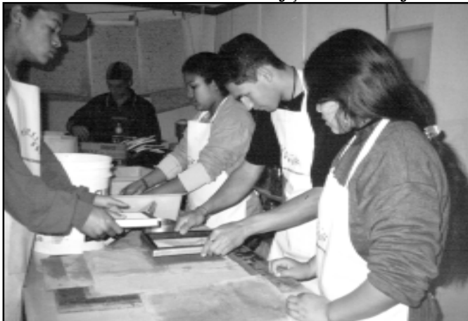
O projeto funciona desde 2001, com o objetivo de capacitar jovens para o mercado de trabalho