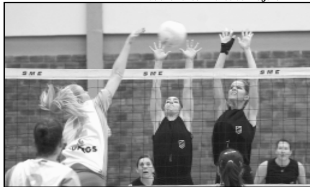
A 3ª edição do Campeonato Municipal de Voleibol conta com 52 equipes participantes