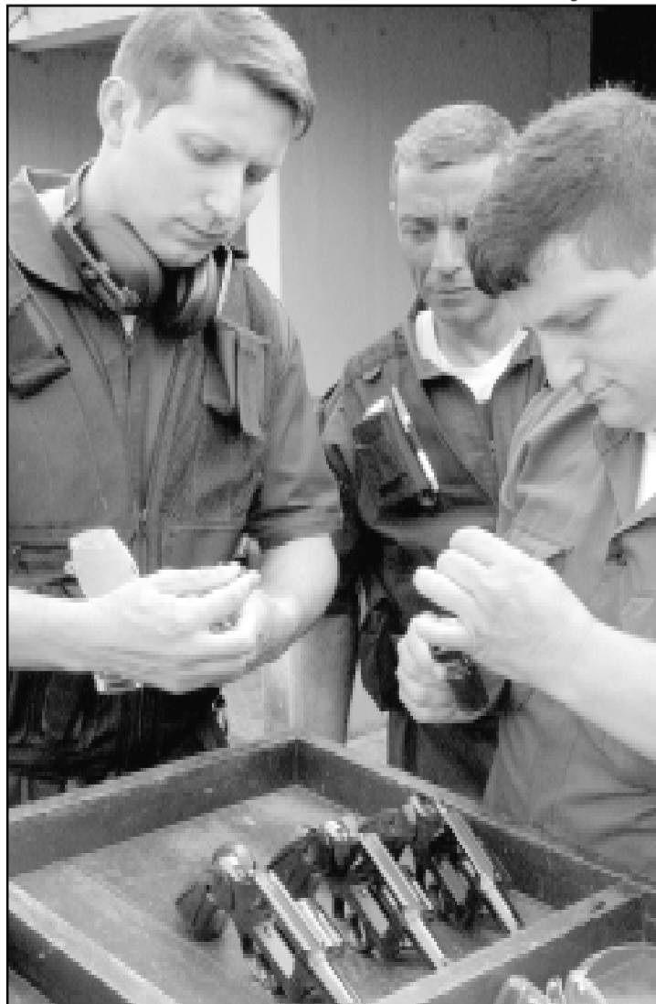
Guardas foram treinados na Brigada Militar

A legalização ainda depende da revogação da Portaria municipal que proíbe a utilização de armamento em Parques e Praças, que deve ocorrer em abril. A expedição dos portes através da Prefeitura resulta do convênio firmado com a Superintendência Regional da Polícia Federal, conforme previsto no Estatuto do Desarmamento. Apenas a cidade de São Paulo, entre as capitais brasileiras, conta com este tipo de contrato.