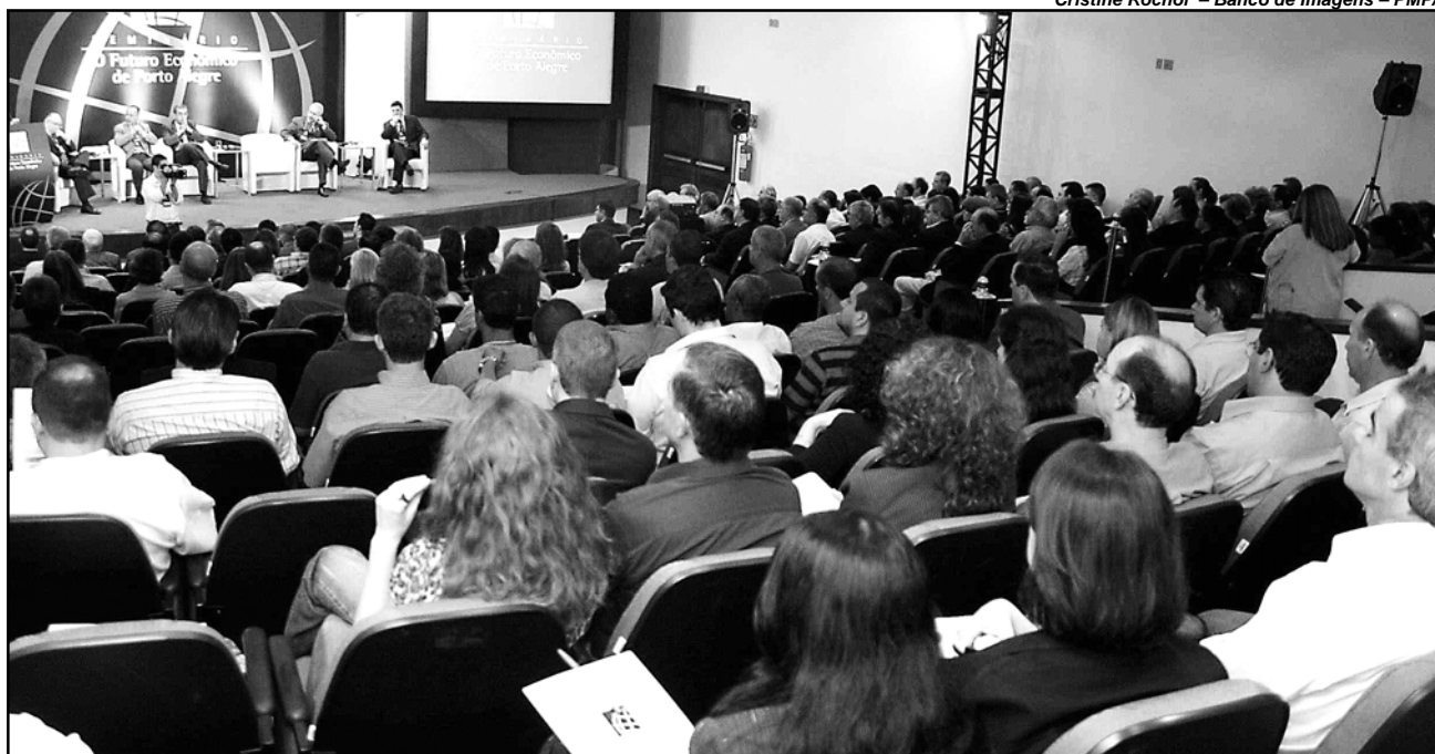
O futuro econômico de Porto Alegre está sendo discutido no seminário que termina hoje