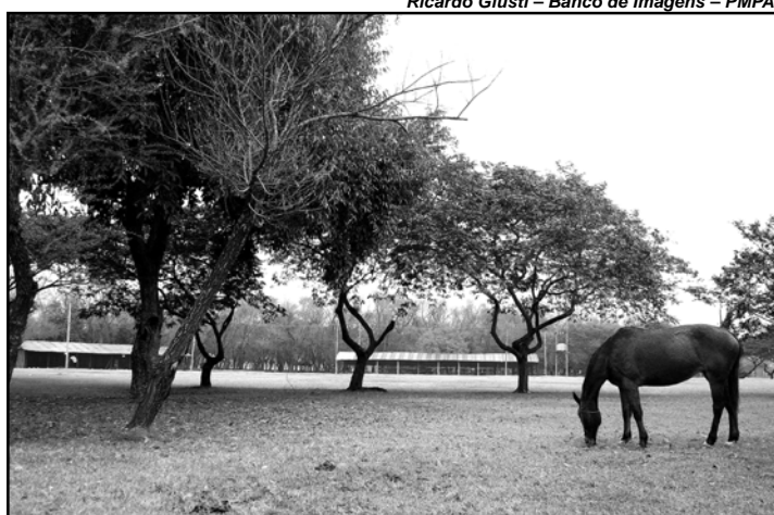
A iniciativa amplia as opções de lazer da rota Caminhos Rurais

Textos elaborados e de responsabilidade da Assessoria de Comunicação da Câmara.