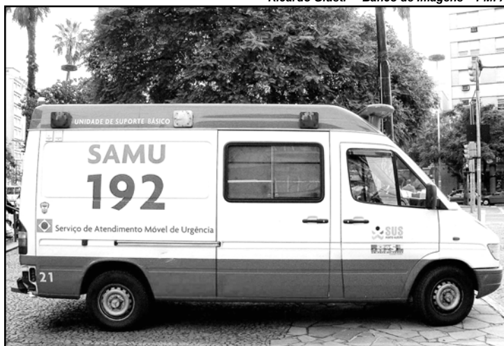
O Samu de Porto Alegre iniciou as atividades em 1995

Esta é a proposta da 1ª Cavalgada da Lua Cheia na Zona Sul de Porto Alegre, promovida pela Cabanha La Paloma, com apoio da Secretaria Municipal de Turismo (SMTur) e da Câ-