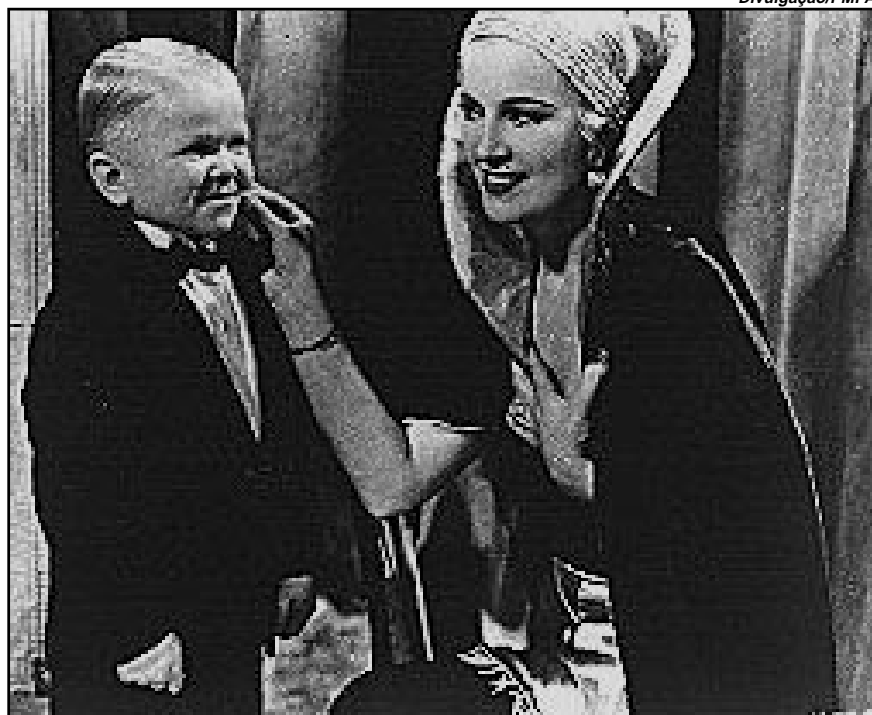
Obra das mais cultuadas pelos cinéfilos, filme causou escândalo na época de sua estréia