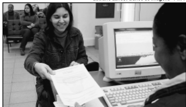
Setor de Licenciamento da Smic agiliza a emissão do alvará

provisório para atividades econômicas de natureza comercial, industrial e de prestação de serviço. “O Alvará Provisório traz para a legalidade os empreendedores da periferia da cidade, que antes estavam vulneráveis por vários motivos técnicos. Agora a Prefeitura vai dar o prazo de um ano para regularização, conforme a nova lei”, declarou o secretário.