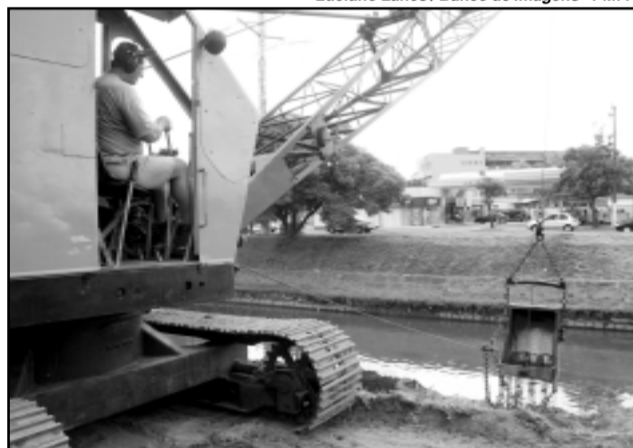
Último trabalho de dragagem aconteceu em 2001