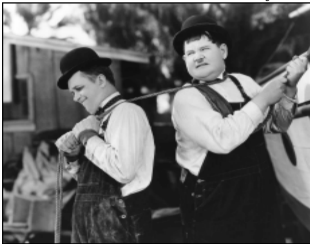
Comédias da dupla O Gordo e o Magro estão na programação

O objetivo do ciclo de filmes é mostrar como o cinema, que tem praticamente a mesma idade do automóvel, registrou em seus primeiros anos a presença do carro nas ruas das grandes cidades e como os indivíduos se relacionaram com esta “macchina veloz”. Serão exibidos títulos conhecidos, como Berlim, Sinfonia de uma Metrópole (1927), de Walter Ruttmann; A Turba (1925), de King Vidor; e Aurora (1927), de F. W. Murnau; além de comédias da dupla O Gordo e o Magro (Buster Keaton e Harold Lloyd). Ao todo, serão apresentados oito títulos, todos do período mudo, em cópias em DVD. A programação completa pode ser consultada no site da SMC: www.portoalegre.rs.gov.br/smc .