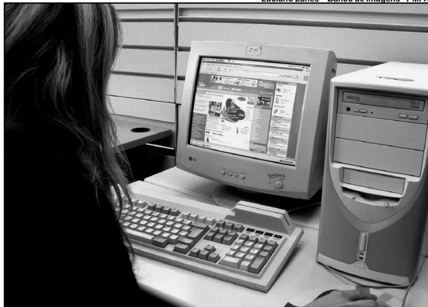
Usuários dos telecentros terão acesso gratuito a cursos de qualificação pelo sistema de ensino à distância