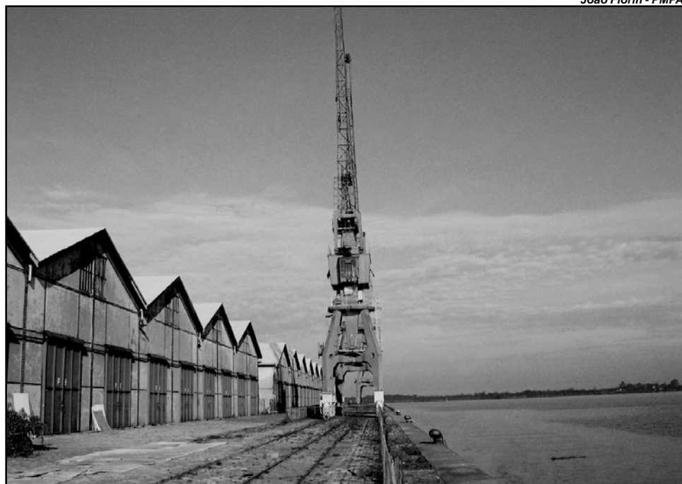
Encontro debate potencialidades e projetos culturais para cidades portuárias