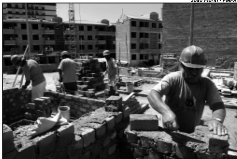
Projeto beneficia 230 famílias

Com custo total de R$ 9,2 milhões, a obra, iniciada em março de 2004, é executada com recursos exclusivos do município, sendo mais de 90% do valor total pagos pela atual administração. Em fevereiro do ano passado, a Prefeitura entregou os primeiros 58 imóveis e nove lojas no Condomínio Princesa Isabel. Os apartamentos são ocupados por 20 famílias procedentes da Vila Zero Hora e 38 da Vila Princesa Isabel, onde está sendo erguido o empreendimento. Os moradores assinaram contrato de direito real de uso, válido por 30 anos, podendo ser renovado ao final do período. O valor mensal pago pelas famílias oscila entre R$ 13 e R$ 26. Depois de concluído, o condomínio deverá abrigar em torno de 800 pessoas.