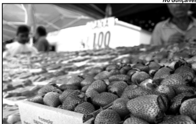
Feira funciona das 9h às 19h

Termina hoje a Feira de Frutas e Flores da Época, montada no Largo Glênio Peres. Com ofertas de ameixas e uvas produzidas na Zona Sul, funciona das 9h às 19h. A promoção é da Secretaria Municipal da Produção, Indústria e Comércio (Smic), em conjunto com o Sindicato dos Produtores Rurais de Porto Alegre. São seis bancas, com produtos de procedência e qualidade garantidas pelo Sindicato dos Produtores Rurais. O projeto Frutas da Época, da Supervisão de Abastecimento da Smic, pretende incentivar o consumo de frutas e produtos da agroindústria da Zona Sul.