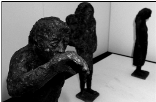
Esculturas estão no andar térreo da Prefeitura

Cinco esculturas em metal de autoria de Xico Stockinger e integrantes do acervo da Prefeitura de Porto Alegre estão expostas desde a última sexta-feira, 27, no andar térreo do Paço Municipal (Praça Montevideu, 10, Centro). Uma das obras pertence à Pinacoteca Rubem Berta e as demais à Pinacoteca Aldo Locatelli. As obras são representadas nas figuras de dois guerreiros e da Série Gabirus I, II e III, essas últimas doadas pelos empresários Justo Werlang e Jorge Gerdau Johanpeter. Os guerreiros permanecem expostos até 15 de março.