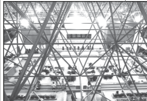
Plenário da CMPA

Textos elaborados e de responsabilidade da Assessoria de Comunicação da Câmara