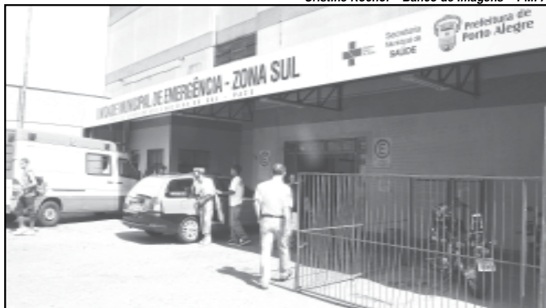
Os investimentos em educação e saúde ficaram dentro dos valores previstos na constituição