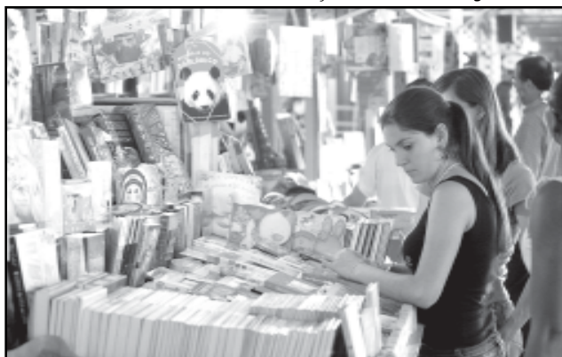
Durante a Feira do Livro o roteiro ocorrerá nas quartas-feiras e nos sábados, a partir das 18h

orientadas foram programadas para ocorrer durante a feira. A promoção é das secretarias do Planejamento e da Cultura e do Programa Viva o Centro.