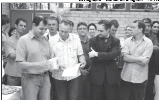
Servidores que completaram 15 e 20 anos de serviço foram homenageados com diplomas

A solenidade de entrega dos diplomas e dos crachás teve a presença do titular da Smic que ressaltou a importância de valorizar o servidor para atingir as metas da administração.