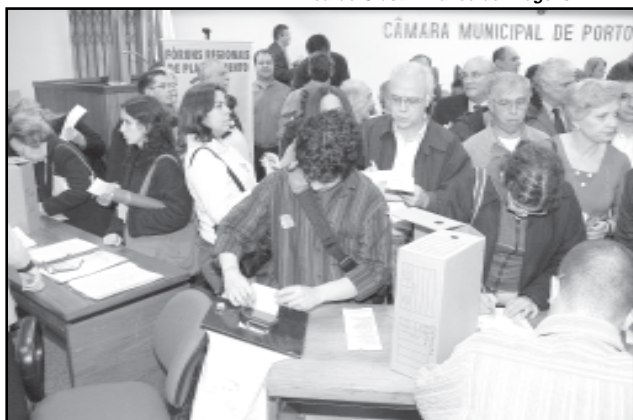
Ao todo, 545 eleitores participaram do processo