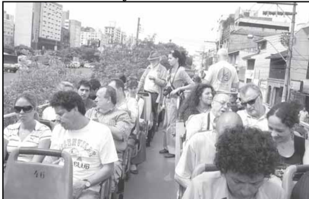
Grupo de americanos e europeus fazem passeio no Linha Turismo