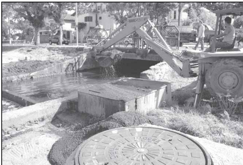
Previsão é de que o trabalho seja concluído em 30 dias