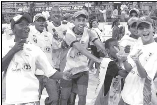
Escola Esporte dá Samba durante desfile no Carnaval 2008

por todos que colaborarem durante o desfile de Carnaval 2009 de Porto Alegre. Sem a utilização de recursos municipais, a campanha é divulgada junto às escolas através de folhetos distribuídos a alunos e professores e encaminhados aos pais.