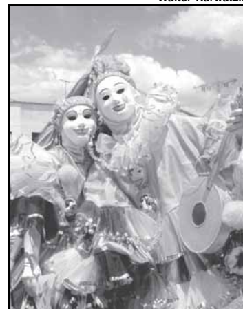
Beleza e alegria no agreste

A mostra Folia dos Papangus de Bezerras, de Walter Karwatzki, pode ser visitada até esta sexta-feira (28/11) no T Cultural Tereza Franco da Câmara Municipal de Porto Alegre (Avenida Loureiro da Silva, 255). Compõem a exposição 26 fotos em preto e branco que registram a beleza, a animação e a irreverência dos milhares de mascarados que, nos domingos de Carnaval, invadem as ruas do município de Bezerras (distante 107 quilômetros de Recife/PE).