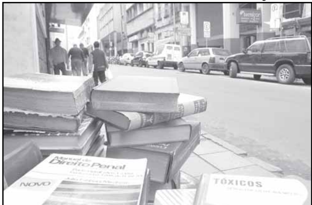
Ricardo Stricher – Banco de Imagens – PMPA

Projeto valoriza os aspectos culturais da região caracterizada pela grande concentração de livrarias