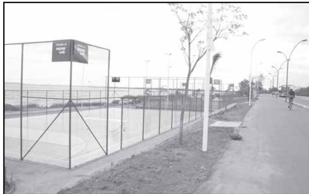
Quadras foram construídas em parceria com a iniciativa privada