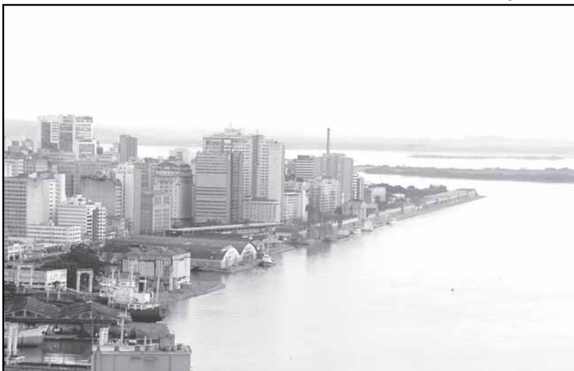
O Dia do Lago é comemorado sempre no último domingo de novembro