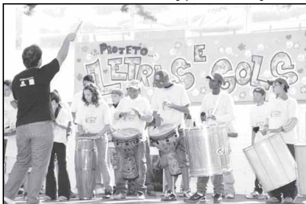
Os jovens serão protagonistas de apresentações artísticas, mostrando suas aprendizagens nas oficinas