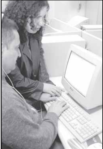
Até novembro, o CCD formou 2.690 pessoas incluindo idosos e deficientes visuais (foto)