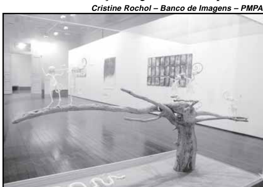
Visitação pode ser feita de segunda a sábado

A exposição das obras dos premiados na II Edição do Prêmio Açorianos de Artes Plásticas reúne os trabalhos dos artistas e entidades que se destacaram no cenário das artes plásticas de 2007, em Porto Alegre. Nesta edição, o artista premiado na categoria Artista Destaque Especial do ano 2007 foi Walmor Correa, com sua obra “Memento Mori”.