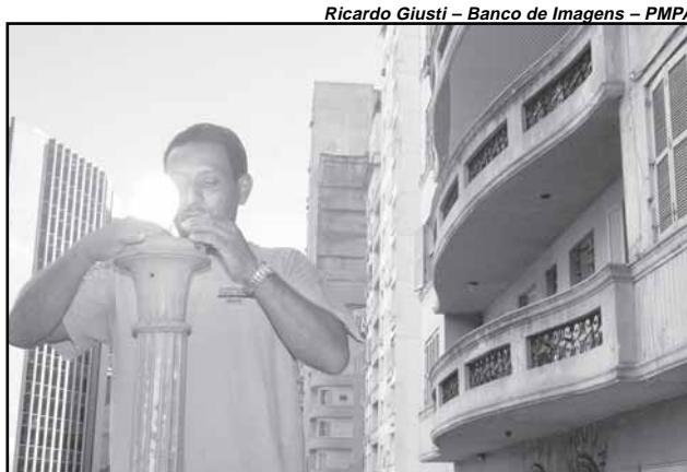
O parque de iluminação da cidade conta com mais de 80 mil pontos

Como doar — Quem quiser fazer a doação pode procurar o Banco de Sangue, no andar térreo do HPS (Largo Teodoro Herzl, s/nº, Bairro Bom Fim). De segundas a sextas-feiras, o horário é das 8h às 18h. Aos sábados, das 8h às 12h. Para segurança dos pacientes, a cada doação serão realiza-