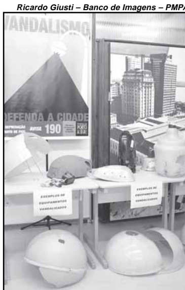
A campanha de combate ao vandalismo na iluminação pública contribuiu para a redução dos gastos

projetores da lateral direita sentido B/C, composta por 800 metros de cabo, que haviam sido danificados por ação de vandalismo; concretagem de caixas de passagens e soldagem de grades e portas da subestação, a qual foi desativada devido à facilidade de acesso aos vândalos; Trevo Carrion Júnior: reposição, através de rede aérea, de 3.000m de cabo multiplex; deslocamento de 2 comandos de acendimento de luminárias; manutenção geral; Viaduto Leonel Brizola: furto de 1.800m de cabo e 8 projetores;