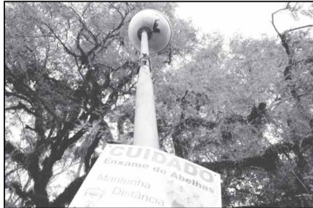
Atualmente, existem 233 solicitações para serem atendidas em áreas públicas