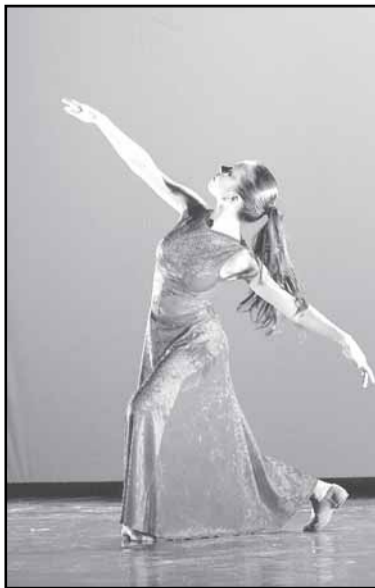
O Dança Usina na 209 integra o projeto Usina das Artes