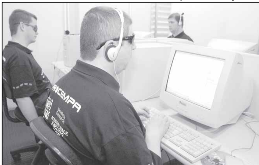
Cursos são gratuitos

O curso é uma parceria da Secretaria Especial de Acessibilidade e Inclusão Social (Seacis), Procempa e Fundação Bradesco. De acordo com a professora