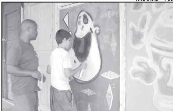
Pintura foi feita por jovens atendidos no Sase e no Trabalho Educativo