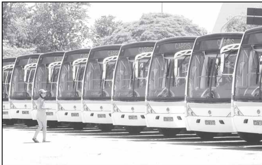
Em novembro de 2008 a Carris renovou a frota com 64 novos veículos