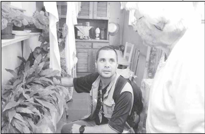
Serão vistoriados 12 mil domicílios em todos os bairros