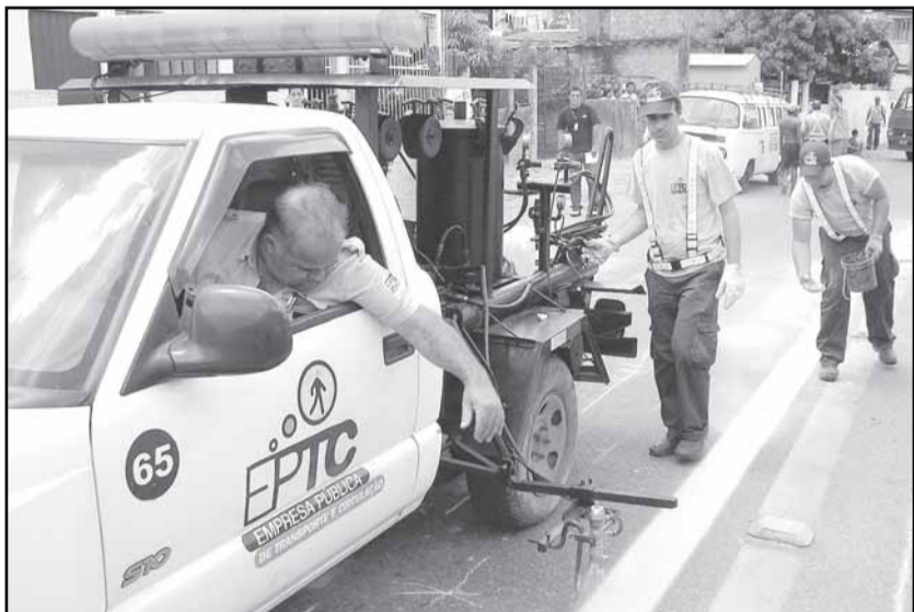
Pintura da pista, instalação de placas e tachões