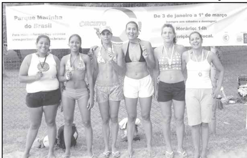
Duplas vencedoras da quarta etapa feminina do Circuito de Vôlei de Praia