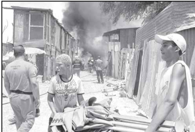
Para abrigar provisoriamente as famílias, Demhab instalará 35 pequenas casas no local

dificuldade está na aceitação da população em ir para o local”, explicou o prefeito.