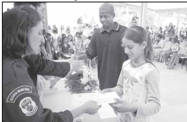
Curso objetiva despertar nos jovens o senso de responsabilidade