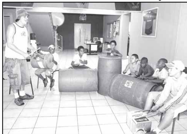
Mais de cem oficinas atenderam a todas as regiões do OP

Segundo ele, mais de cem oficinas atenderam a todas as regiões do OP, passando pelas comunidades mais carentes, onde cada vez mais é possível encontrar um oficinairo ensinando arte, traduzindo diversas expressões para diferentes aptidões e revelando novos talentos no cenário da cidade.