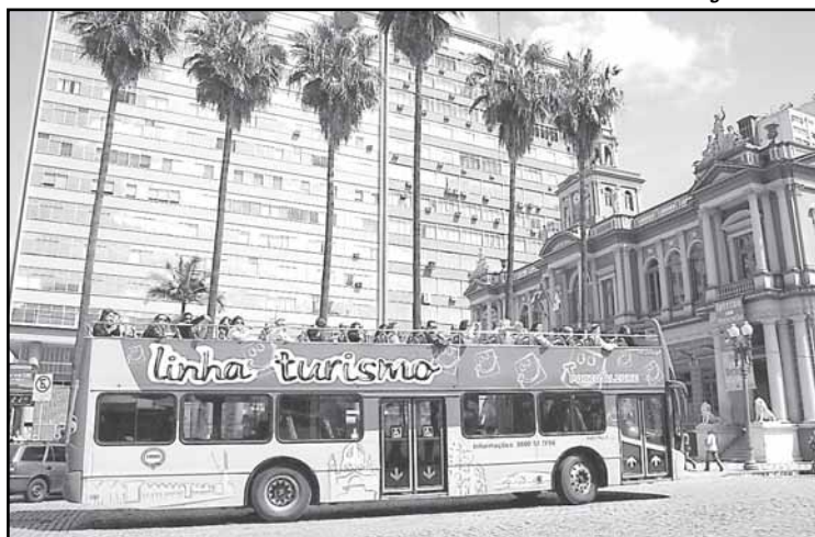
Linha Turismo dará desconto para quem doar caixa de bombons

fica na Travessa do Carmo, 84, bairro Cidade Baixa. Reservas e informações pelo telefone 3289 6744.