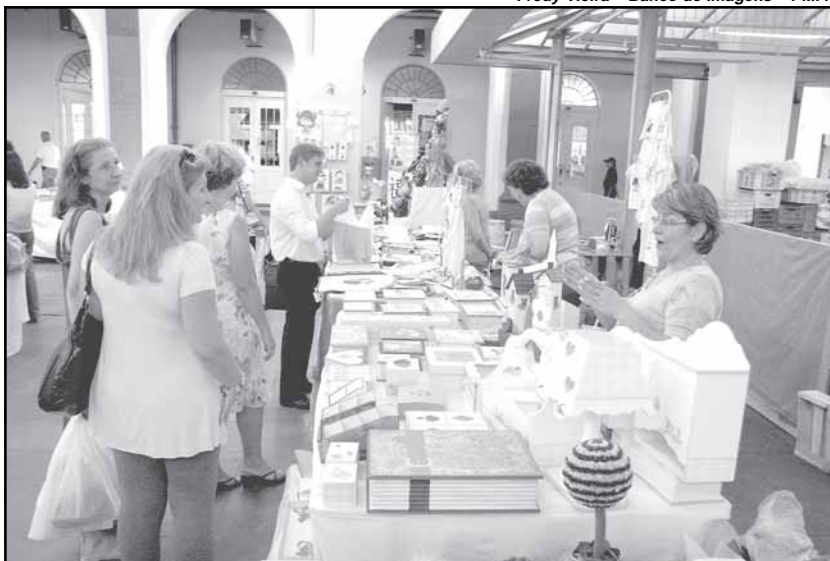
Artesanatos confeccionados em oficinas com materiais reciclados estão à venda até sábado

O ônibus panorâmico tem suas saídas marcadas para as 9h, 10h30 e 15h no roteiro Tradicional e às 13h30 e 16h30 com o roteiro Zona Sul. O terminal