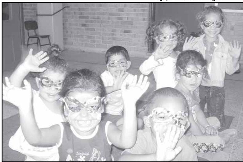
Atividades incluíram brincadeiras para as crianças