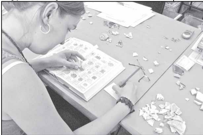
Material encontrado revelará hábitos dos portoalegrenses no século XIX