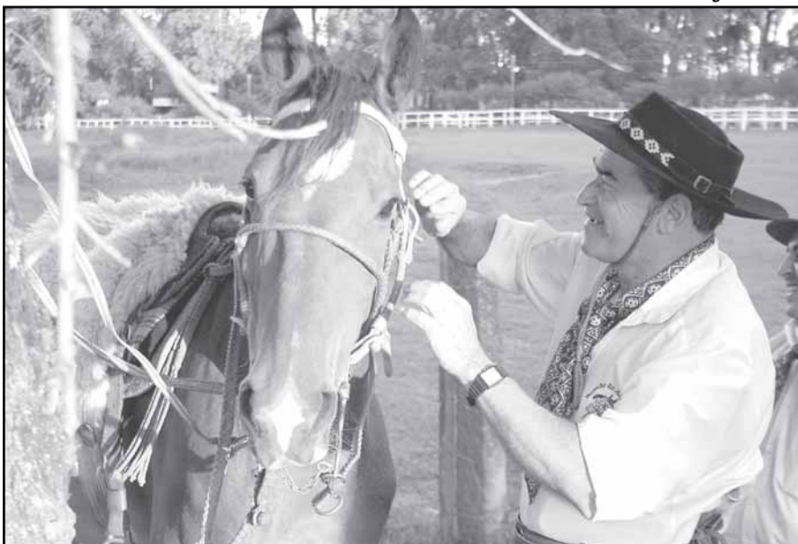
Atividade completa um ano com a participação de aproximadamente 1.500 cavaleiros