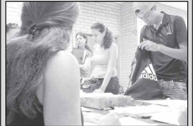
Seleção acontece na Osvaldo Aranha, 308