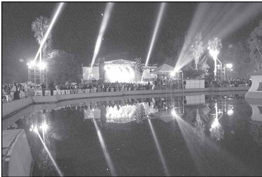
Baile da Cidade reuniu cerca de 30 mil pessoas ano passado