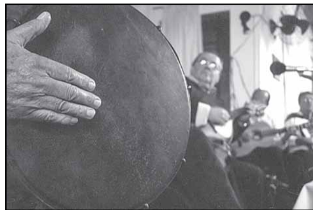
Músicos nos saraus das quintas-feiras