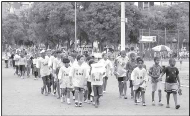
Desfile do Festibal no ano passado mobilizou participantes do programa

tebol do Programa ECCE chamado de “Festibal”. Haverá desfile com a presença da banda da Brigada Militar, hasteamento das bandeiras e jogos de futebol festivos em quatro campos nas categorias pré, mirim, infantil e livre feminino.