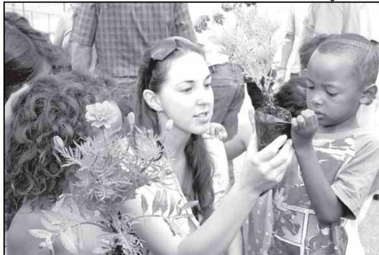
Plantio de árvores revitaliza o espaço público