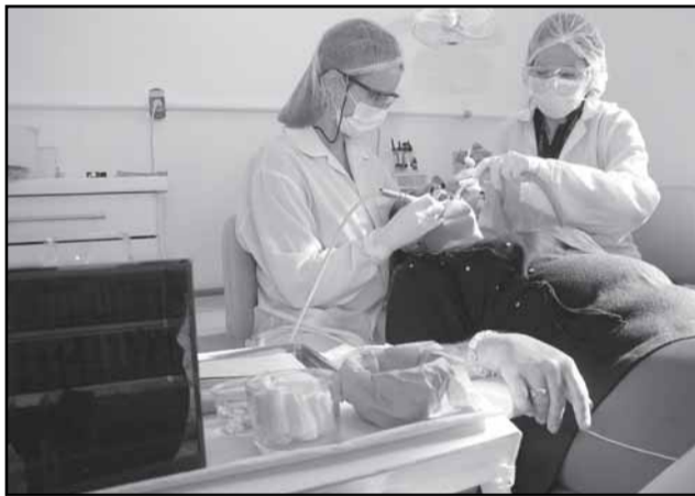
Consultório funciona de segunda a sexta, em dois turnos