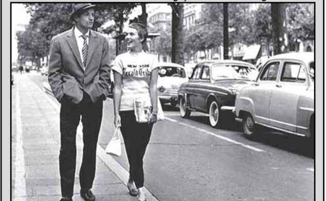
Cena do filme Acrossado , um dos destaques da programação