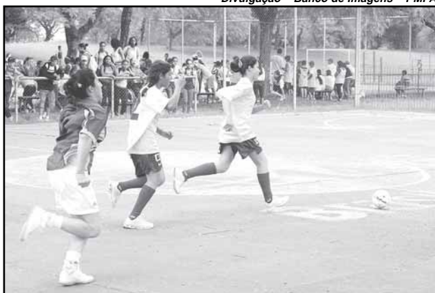
Jogos terão a participação de dez mil alunos de 50 escolas

Até o próximo dia 20, o evento contará com a participação de dez mil alunos a partir dos seis anos, de cerca de 50 escolas da rede municipal, incluindo estudantes da Educação de Jovens e Adultos (EJA). A iniciativa tem apoio do Departamento Municipal de Água e Esgotos (Dmae), da Guarda Municipal, da Escola Superior de Educação Física da Ufrgs, do Centro de Promoção da Criança e do Adolescente e do Centro Vida.